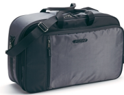
Sac interior pentru cutia de bagaje de 50L a FJR-ului