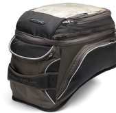
Sac turism pentru FJR cu montare pe rezervor