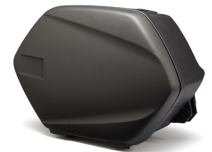
Portbagaje laterale de 20 l pentru touring

Pentru toate FJR1300AS accesoriile vizitati site-ul sau verificati la distribuitorul local.